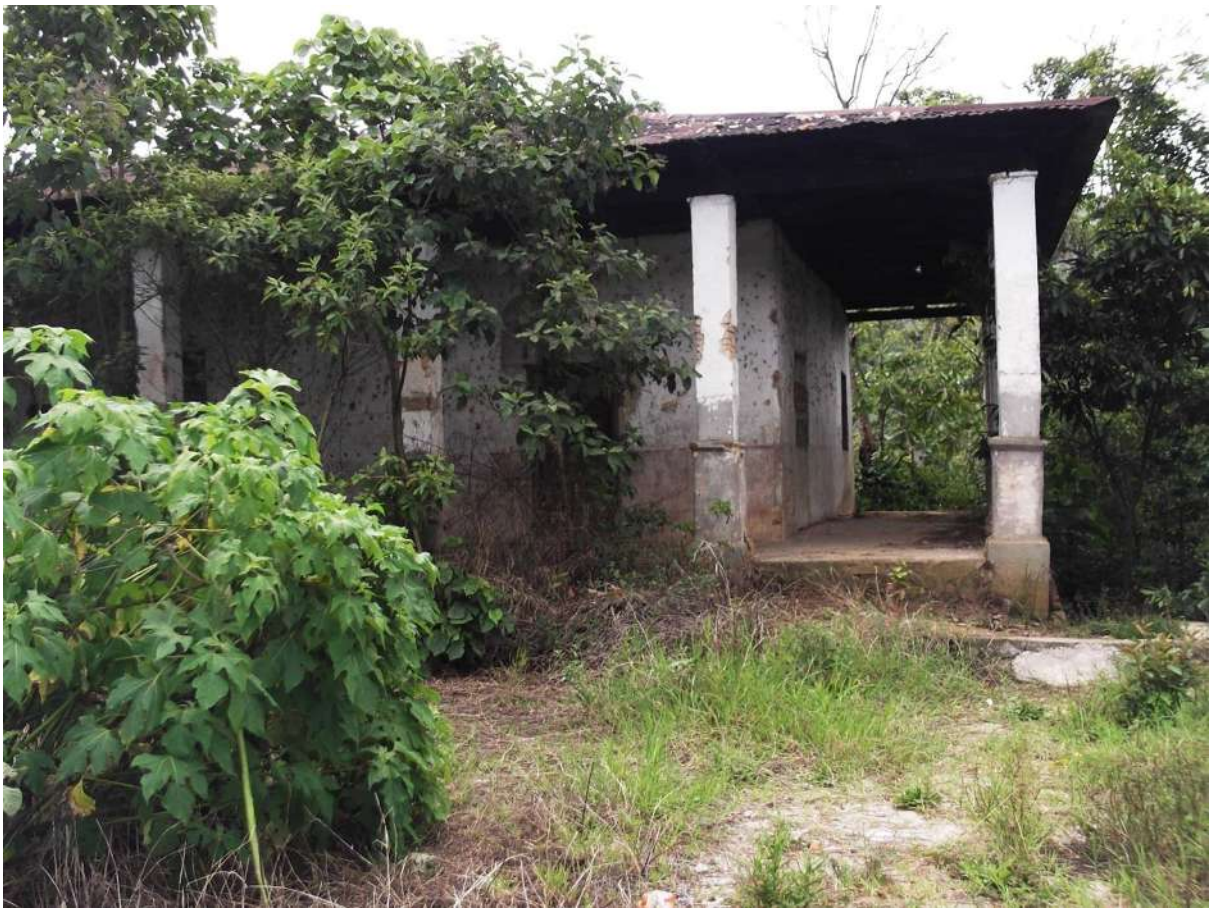
Imagen tomada en la propiedad ex finca La Tierra, en el Municipio de Tumbalá, Chiapas México, 15 de mayo del 2013.

antes y después del periodo porfirista, pero podemos afirmar acertadamente que fue en este periodo cuando esta finca apareció en el territorio tumbalteco, debido por las leyes emitidas del gobierno porfirista a nivel nacional, para el deslinde y colonización de tierras por extranjeros y algunos nacionales e instalar así negocios alentadores, pues esta era la política de inversión económica que represento este gobierno, mencionado anteriormente. Pero también se debe a que en el año de 1891 la cafecultura en Chiapas cobró un gran impulso, debido a las nuevas estructuras de propiedad que implemento Emilio Rabasa, que tuvieron que ver por el aumento del precio del grano en los mercados; lo que prolongó que muchos inversionistas hayan optado instalar empresas cafetaleras en distintas zona de la entidad; como en la Selva Norte donde se encuentra ubicado también el territorio tumbalteco; en donde se desarrollaron varias fincas dedicadas principalmente en el trabajo del café en el dicho periodo.