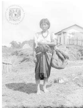
mujer chol mostrando su indumentaria 1939-1946, Tumbalá, Chiapas, medidas 3x5 pulgadas