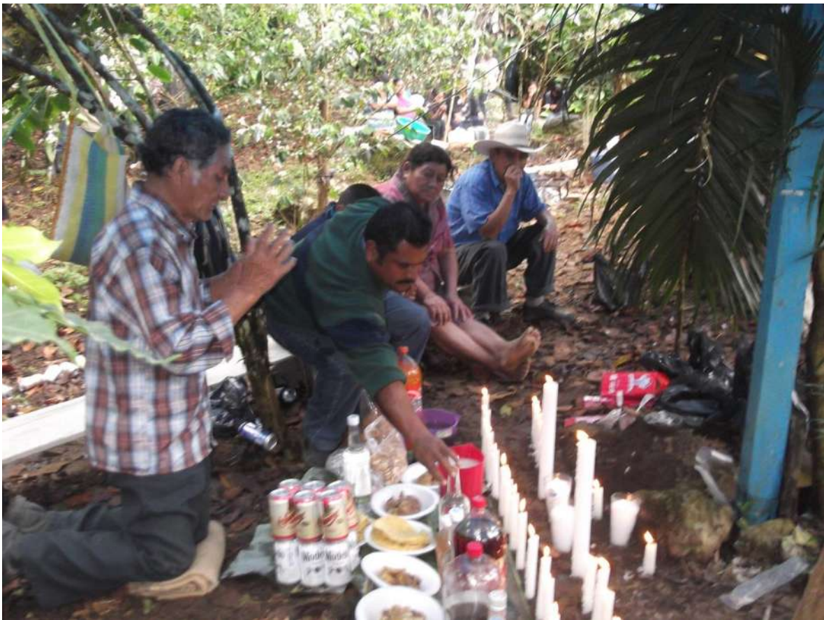
Imagen tomada en el rancho “Estrella de Belén”, Rito cho`l, En honor a la Santa Cruz y al señor del Pozo, 3 de mayo del 2013, Tumbalá Chiapas, México.

representándose la danza del tigre, el 3 de mayo se celebra a la Santa Cruz y al Señor del Pozo, el 8 de mayo a San Miguel de Arcángel el patrono del pueblo tumbalteco y el 12 de diciembre en celebración de la virgen de Guadalupe. En las celebraciones católicas en Tumbalá siempre está presentes el sincretismo maya. Y en los ritos mayas que celebran los cho`les en honor a las divinidades de su creencia y cultura, también están presentes el sincretismo católico, a veces se pide a las divinidades lluvia cuando hay sequía, sol cuando hay demasiada lluvia, a la madre tierra de proveer buenos frutos del maíz, frijol y todos los frutos de autoconsumo existentes en la región, a los manantiales para que no se sequen, para que así los habitantes ch`oles no sufran las necesidades básicas. O a veces estas festividades son en agradecimiento a las divinidades por haberles provisto buenas cosechas, buenas siembras, un buen año etc.