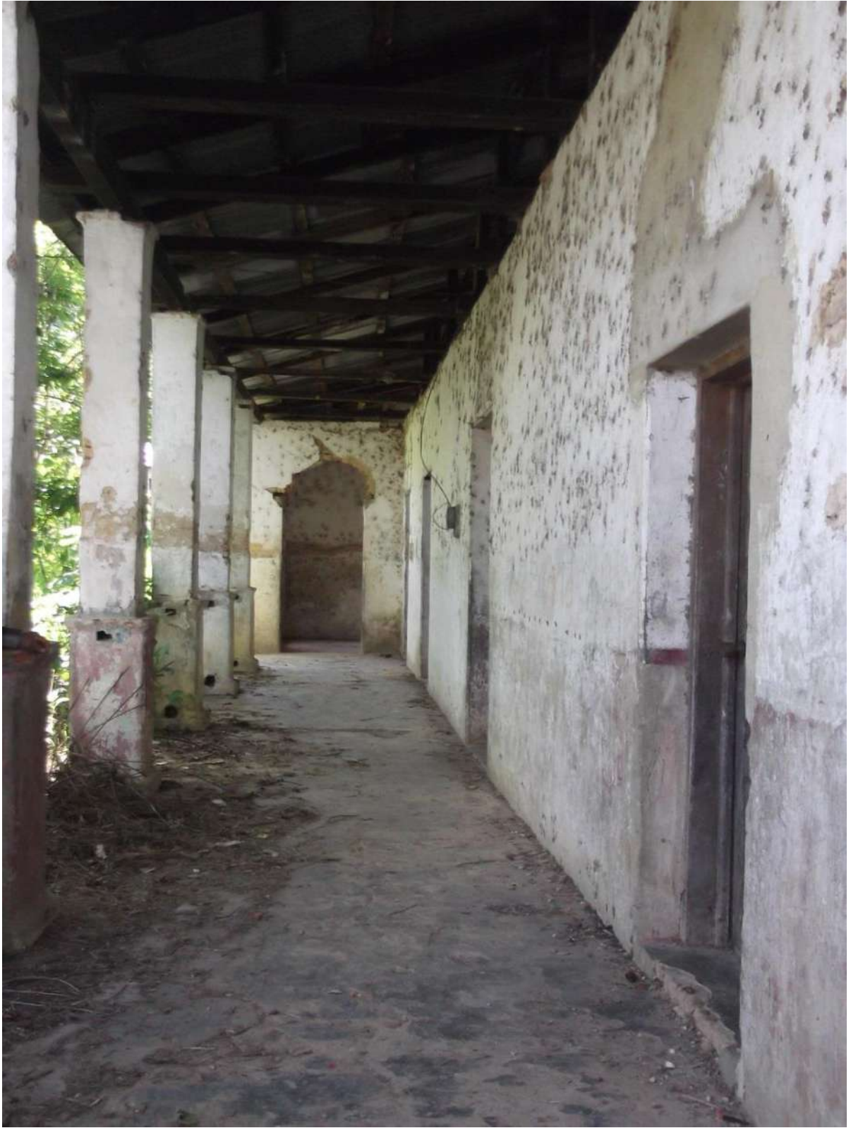
Imagen tomada en la propiedad finca La Tierra, en el Municipio de Tumbalá, Chiapas México, 15 de mayo del 2013.