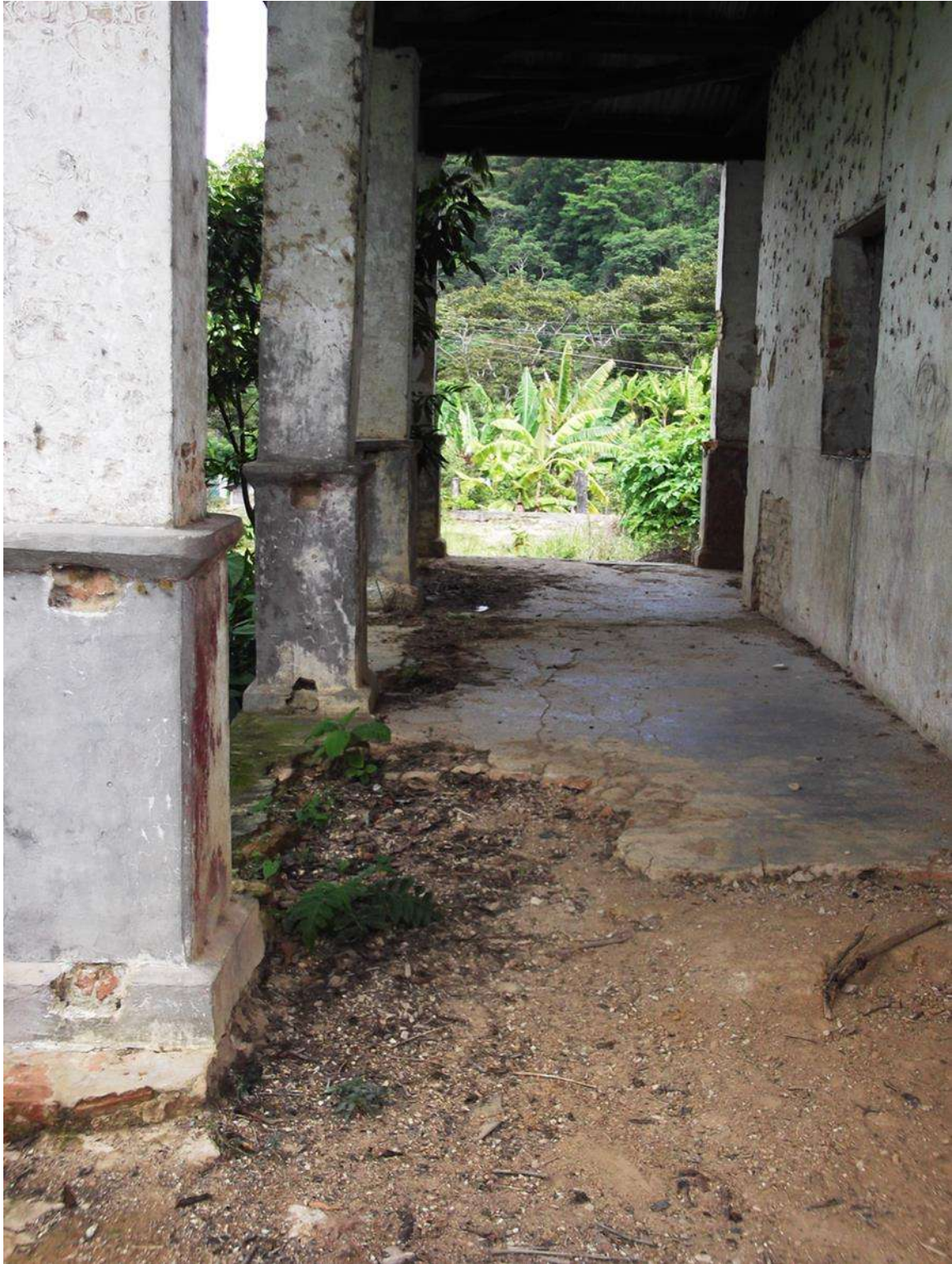
Imagen tomada, en la propiedad finca La Tierra, en el Municipio de Tumbalá, Chiapas México, 15 de mayo del 2013.