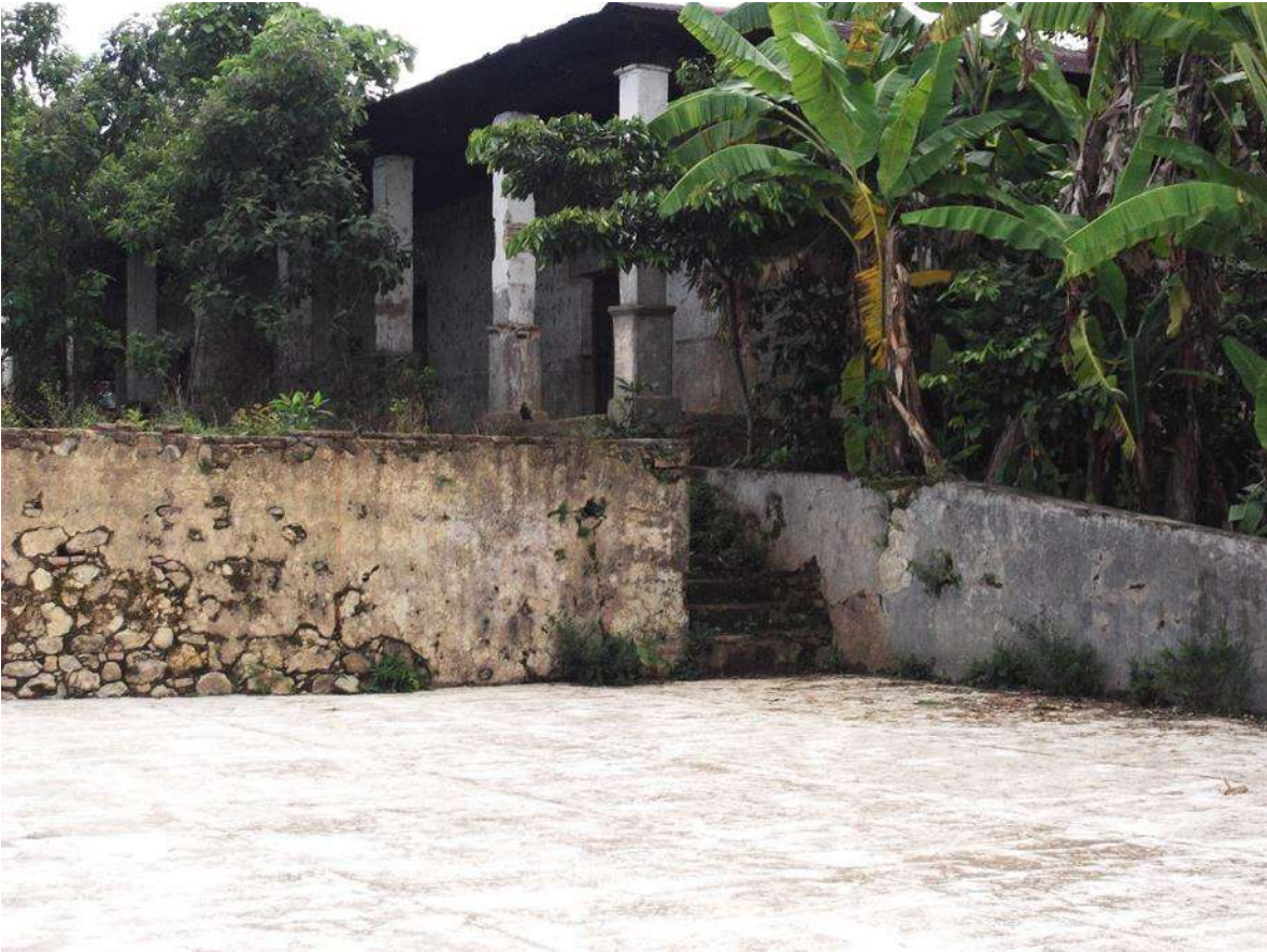
Imagen tomada en la propiedad finca La Tierra, en el Municipio de Tumbalá, Chiapas México, 15 de mayo del 2013.

metros de donde estamos realizando la entrevista) que así pasaron muchos años, puro trabajo sin descanso cortar café, lavarlo, secarlo. Nuestras mujeres, abuelas, los niños también trabajan, todos trabajaban, fueron tiempos de muchas explotaciones, maltratos 133 .