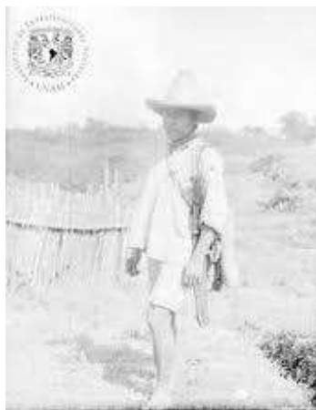
Hombre chol mostrando su indumentaria, 1939-1946, Tumbalá, Chiapas, medida 3x5 pulgadas, Repositorio Universitario Digital de Instituto de Investigaciones de la UNAM.