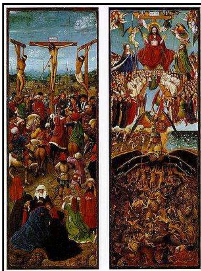
Van Eyck, Jan. “ Díptico: La Crucifixión y el Juicio Final ”. Lienzo, 1426, Museo Metropolitano de Arte, Nueva York.

Un díptico que es autoría de Van Eyck es La Crucifixión y el Juicio Final , ésta obra en tabla que se divide en dos episodios es de carácter religioso; en la primera parte que es la Crucifixión marca como el credo religioso representa a Dios crucificado con aquellos que se lamentan por el dolor que sufre por los pecados de la humanidad, se percibe el dolor que han cometido sobre Jesús en su martirio así como la herida que se le realizó en su pecho por medio de una lanza.