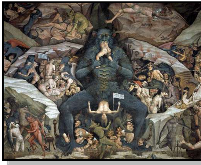
Da Modena, Giovanni. “Inferno” .

Giovanni da Modena (1379-1455). Pintor italiano cuyo aspecto imprescindible fue el realizar el fresco de nombre Inferno , trabajo que sitúa al Diablo como el centro de atención quien ejerce el dolor, tormento y sufrimiento al pecador junto con sequito de demonios. Esta singular obra artística terminada en 1410, se encuentra en la Basílica de San Petronio, en la Capilla Bolognini, Bolonia, Italia. Éste trabajo fue mandado a realizarse por la voluntad de Bartolomeo Bolognini en 1408.