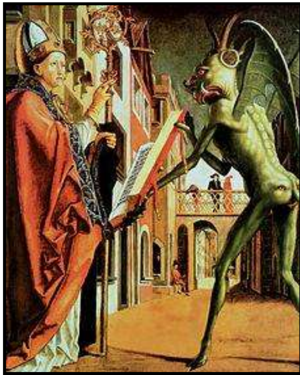
Pacher, Michael. “San Agustín y el Diablo” .

Michael Pacher (1435-1498). Nacido en Austria en el siglo XV, pintor y escultor con especial énfasis en el estilo gótico. Su trabajo se centró en temas religiosos, su concepto medieval forjó un estilo de una marcada influencia de artistas italianos como Andrea Mantegna, por otra instancia recibió una marcada atribución en su trabajo por las obras de origen alemán. Una de sus obras con mayor ahínco en representar a Satanás con una presencia divina es: San Agustín y el Diablo , trabajo que se encuentra en la Pinacoteca de Múnich, Alemania.