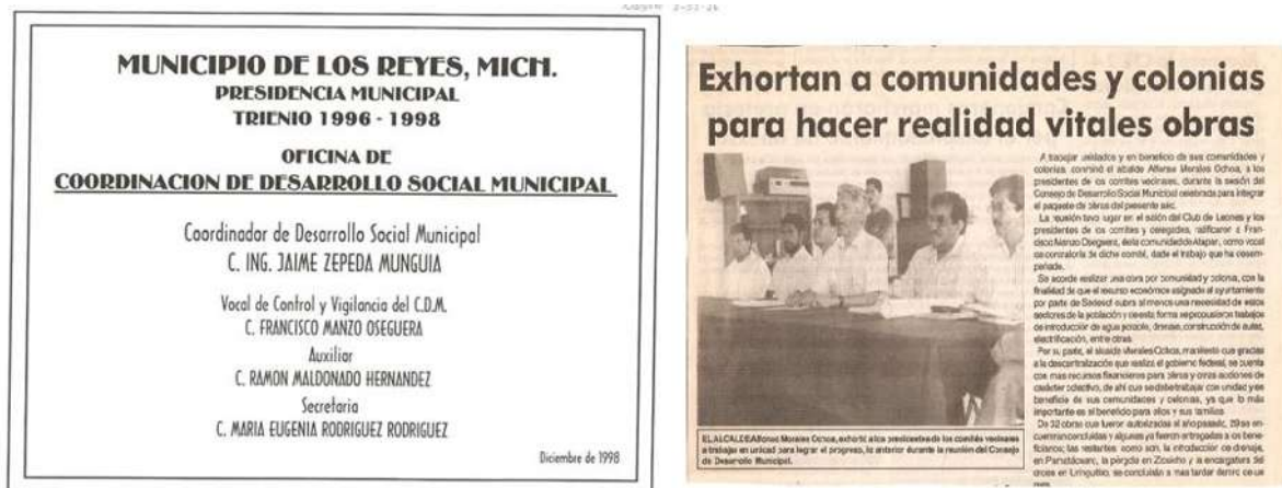
Figura 2. 2 Conformación de la coordinación municipal.