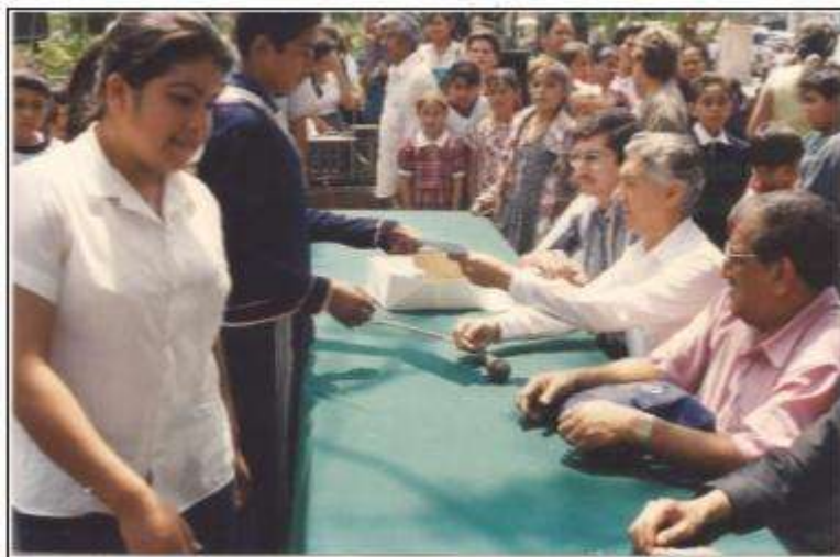
Figura 2.4 Evitando la deserción estudiantil.