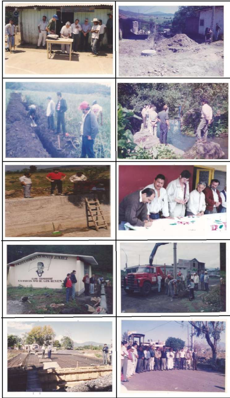
Figura 2. 3 Firma del acta de entrega-recepción y supervisiones de obra