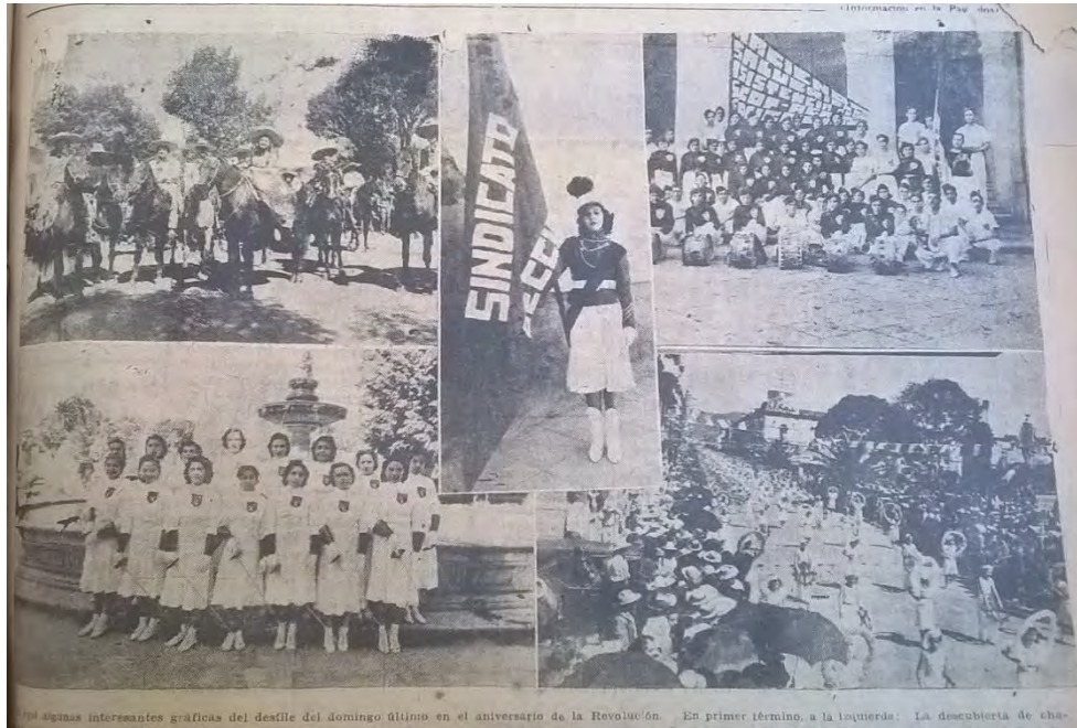
Ilustración 2. HPMJT, El Heraldo Michoacano , Año 1, Tomo I, Martes 22 de Noviembre 1938, Morelia Michoacán. En la primera página se plasmaron varias imágenes de la celebración del 20 de noviembre de ese año.

desde muy tempranas horas de la mañana la población se dio cita a lo largo del recorrido. 312