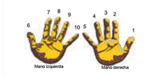
Imagen 4. Modelo para la captura de huellas digitales. *350

El orden para tomar las huellas es: tomar las cuatro huellas de la mano derecha e izquierda al mismo tiempo y después tomar las de los pulgares.