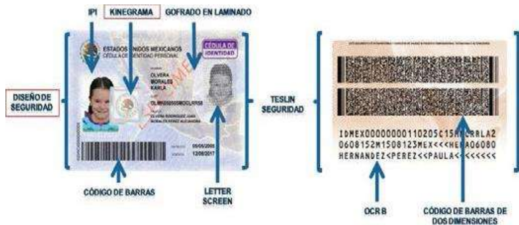
Imagen 1. Elementos Físicos de seguridad de la Cédula de Identidad Personal.*

El primer nivel de seguridad incluye elementos que son visibles a la vista, como se muestra en la figura: