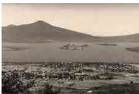
Ilustración 11 Lago de Patzcuaro