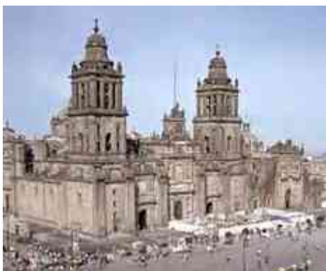
Ilustración 25. Catedral de la Ciudad de Mexico

De igual manera en la Ciudad de México para el mejoramiento del Centro Histórico se realizaron varios programas, algunos de ellos son: