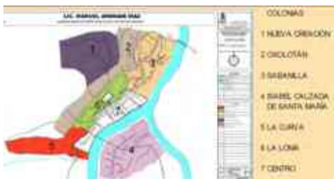
Ilustración 18. Colonias de Tapijulapa, Tabasco

Eligimos El Estudio de Mejoramiento de Imagen Urbana de Villa Tapijulapa, Tacotalpa, Tabasco como anologo, porque tiene un contenido bastante desarrollado y está basado en el Programa de Desarrollo Urbano del Centro de Población (PDUCP) de la Villa Tapijulapa 1 , “como una prioridad del gobierno actual. Para conducir, aplicar, difundir y evaluar la política sectorial de desarrollo urbano” 9 .