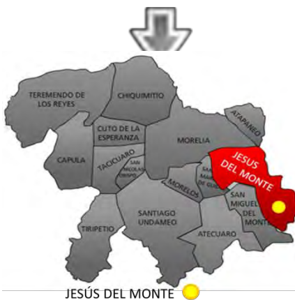
Ilustración 44. Ubicación de Jesús del Monte