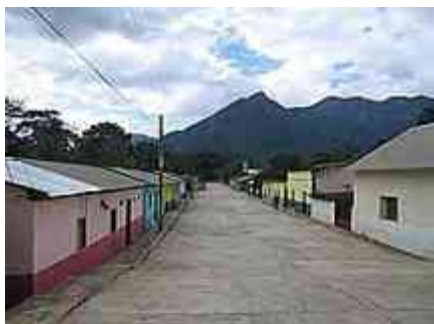
Ilustración 23 Cerro la Campana

Mejorar significa que el centro de población de Villa Tapijulapa tiene carencias e Insuficiencias que deben ser atendidas, para aumentar el nivel de vida y ampliar su Atractivo sin el menoscabo de su imagen tradicional.