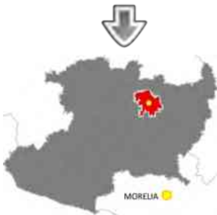
Ilustración 43. Ubicación de Morelia