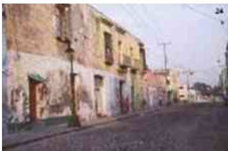
Ilustración 30. Sección de una manzana

Esta delimitación inicial se realiza con base en una serie de consideraciones funcionales ligadas al desplazamiento poblacional debilitamiento de las manifestaciones culturales locales en el espacio público y privado.