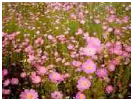
Ilustración 8 mirasoles

las readecuaciones de un espacio es una toma de conciencia reflexiva sobre la realidad y la complejidad que exista en el sitio. tratando, de objetivar lo simbólico para que su impregnación social sea mayor. Así, el espacio pasa a poseer un significado aceptado comúnmente, por los habitantes del lugar.