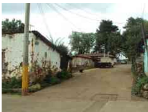
Ilustración 17. Acceso de la zona sur de la Tenencia

Entendida básicamente como una formación lineal y elemento de transición entre el espacio público y privado es entonces donde a partir de la calle se organiza y distribuye la trama urbana.