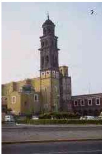
Ilustración 27. Catedral de Puebla

Revitalización de los barrios colindantes al desarrollo turístico y comercial del Centro Histórico de Puebla, México.