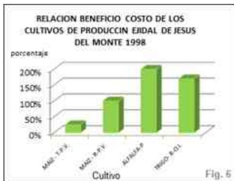
Ilustración 37. Beneficio de los cultivos de producción.