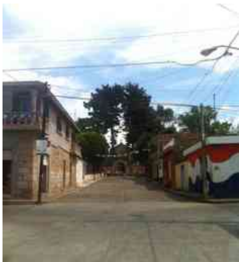
Ilustración 6. Calle José Ma. Morelos que conecta con la plaza

El espacio urbano se caracteriza como un modelo de estructura determinado por su uso social, en el que sus diversos componentes físicos, sociales y mentales son partes que intervienen en la constitución de un todo.