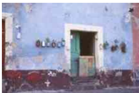
Ilustración 31. Deterioros

El énfasis temporal considera el período 1993-1997 y los escenarios al 2004 y 2010. Se considera como períodos de análisis referencial las décadas de los años 80 y 90.