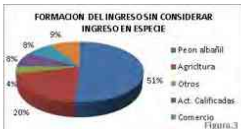
Ilustración 36. Actividades de trabajo en Jesús del Monte

Con la cercanía al centro de Morelia la mayoría vienen y venden sus productos. La albañilería está presente en el 47% de las familias entrevistadas y, en la mayoría de los casos hay más de un miembro de la familia que se dedica a esta actividad. Además, la albañilería es la principal fuente de ingresos. En la encuesta realizada se observó que esta actividad representa el 51% del ingreso total monetario. En relación con la fuerza de trabajo, la albañilería se visualiza como la principal especialización ya que esta actividad ocupa el 54% del total de la fuerza del trabajo familiar. El rango de edades de las personas que realizan esta actividad es amplio y va de los 17 a los 47 años (figura 3 y 4). Sin embargo el 73% de las personas que se dedican a esta actividad son jóvenes de menos de 25 años y la mayoría se integra a esta actividad al salir de la secundaria, es decir alrededor de los 16 años. Lo anterior significa que los costos de oportunidad de la población