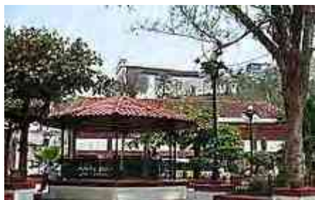
Ilustración 22. Parque Tapijulapa

le han dado una identidad propia, que refleja la interpretación socio cultural de sus pobladores, aunando la riqueza natural de su entorno, la Villa tiene la oportunidad de resaltar sus valores a los turistas que la visitan.