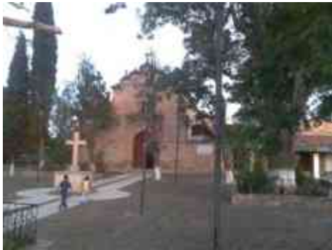
Ilustración 15 Atrio de la iglesia del Sr. de la columna

Definiremos como “Centros Históricos” a “todos aquellos asentamientos humanos vivos, condicionados por una estructura física proveniente del pasado, reconocibles como representativos de la evolución de un pueblo.” 7 Hoy en día, los centros históricos son áreas de valor cultural y arquitectónico que forman parte de un área metropolitana o ciudad de una población considerable, que posee diversas y complejas funciones diarias.