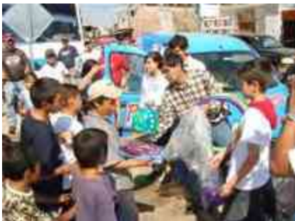
Ilustración 2 niños de la tenencia

La sociedad y el entorno conceptual del espacio es determinada tanto en la naturaleza física de su envolvente, así como en la abstracción de su estructura, al constituirse el elemento de intercalación entre el individuo y su entorno se crea una atmosfera de carácter objetivo.