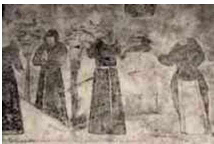
Ilustración 13 Pinturas de la iglesia Jesús del Monte.