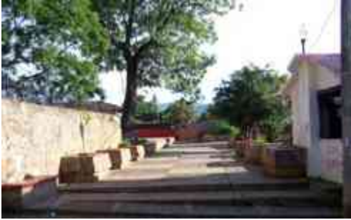
Ilustración 16. Acceso principal de la Tenencia Jesús del Monte

La función específica que le dio la razón de ser a la plaza fue sin duda la de reunión pública para el intercambio de bienes y servicios, es decir el mercadeo, y con el paso del tiempo se fue aderezando con otras actividades como las recreativas, sociales, o de concentraciones políticas.