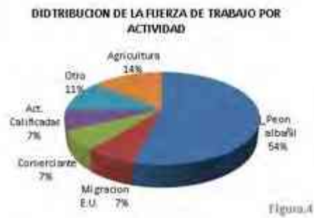
Ilustración 38. Actividades de fuerza de Trabajo.