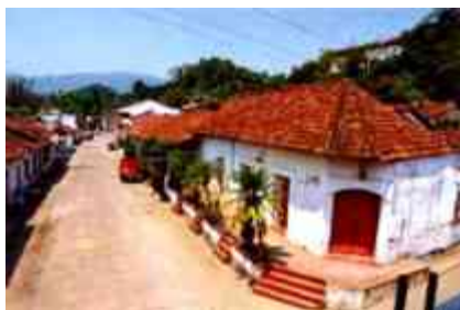
Ilustración 21. Tapijulapa Villa Luz

le han dado una identidad propia, que refleja la interpretación socio cultural de sus pobladores, aunando la riqueza natural de su entorno, la Villa tiene la oportunidad de resaltar sus valores a los turistas que la visitan.