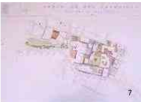
Ilustración 29. Sección de una manzana

Gran parte de los problemas generados por la realización del Proyecto denominado Paseo del Río San Francisco ( PRSF ) Se deben a la transformación agresiva de los usos del suelo en el sector del proyecto, así como el entorno urbano inmediato, estructurado por barrios cuya antigüedad se remite a la primera mitad del siglo XVI .