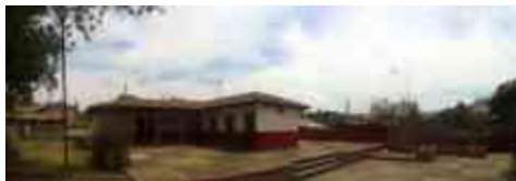
Ilustración 4. Jefatura de la tenencia en Jesús de Monte