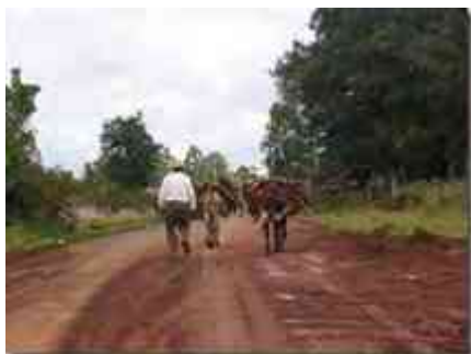
Ilustración 7 caminos de Jesus del monte año 2006