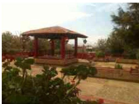
Ilustración 5. Kiosco de la tenencia Jesús del Monte