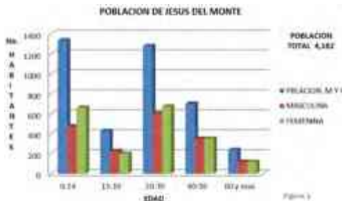
Ilustración 35 Taba de Población.

Grafica sintetizada que contiene conteo de población de INEGI 2010, ilustración 35 donde se incluye el número de pobladores con referencia a su edad y sexo de la Tenencia Jesús del Monte