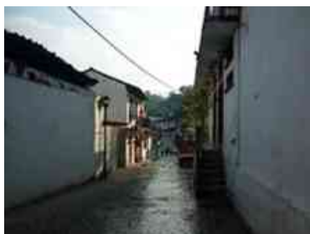
Ilustración 24. Calles de Tapijulapa