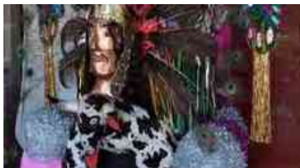
Ilustración 33. Torito