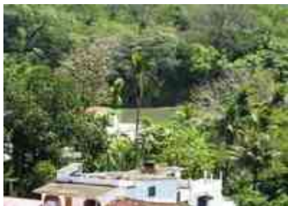
Ilustración 19. Villa de Tapijulapa