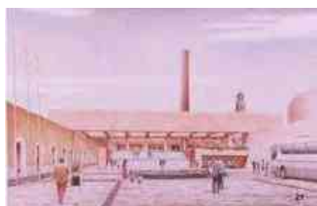
Ilustración 32. Imagen resultante

Estamos iniciando con el Plan de un sector emergente que se basa en las siguientes premisas: