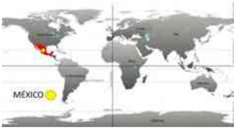
Ilustración 41. Ubicación de México