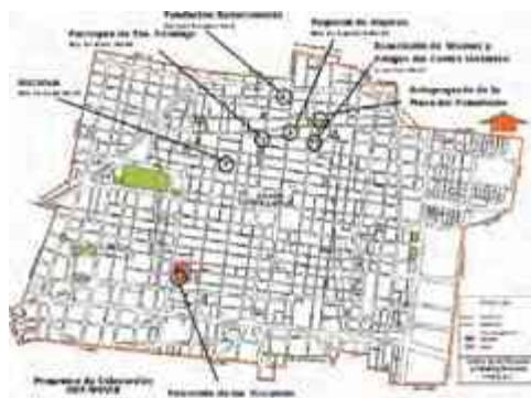
Ilustración 26. Plano Modelo del Proyecto de los espacios a mejorar

Identificar y estudiar las demandas sociales, diseñar proyectos y analizar su factibilidad de inversión