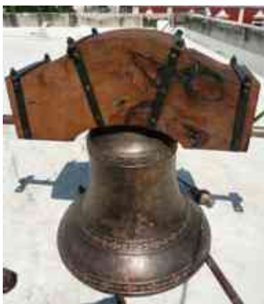
Ilustración 34. Campana con esquila