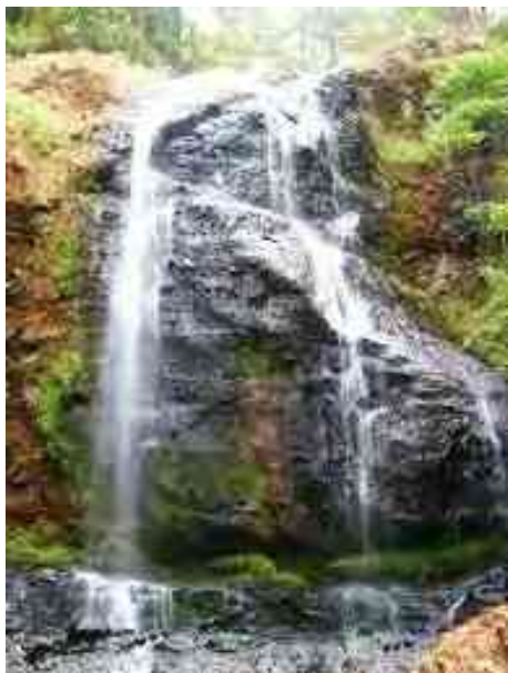
Ilustración 9 Cascada el Salto Ichaqueo