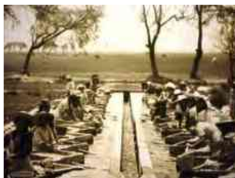
Ilustración 12 Canaleta para el uso del agua

Pueblo cuyo idioma ha sido llamado Matlatzinca el cual pertenece a lenguas otomanas, es decir, comparten características con el hñahñu y el mazahua en cuanto a raíces, posteriormente a ser una lengua tonal, y a la construcción gramática. La familia Matlatzinca se divide en 2 lenguas prácticamente extintas en la actualidad: el Matlatzinca y el ocuilteca; Ambas lenguas habladas antiguamente en el estado de México, Michoacán y Guerrero posteriormente recibieron la presión de otras lenguas; primero fue de la náhuatl después el tarasco y por ultimo del castellano.