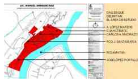
Ilustración 20. Colonia de Oxocotlán

Al hablar de la imagen de Villa Tapijulapa, se refiere al estilo, color, traza y ambiente, de la zona remodelar.