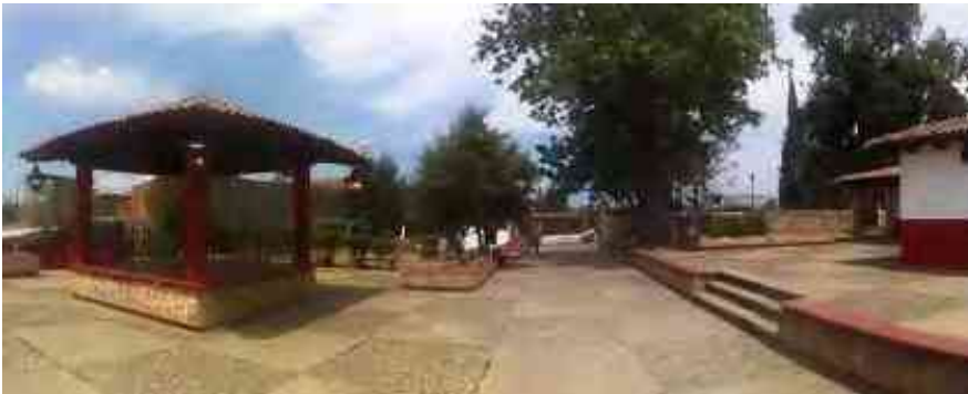
Ilustración 1. Tenencia de Jesús del Monte