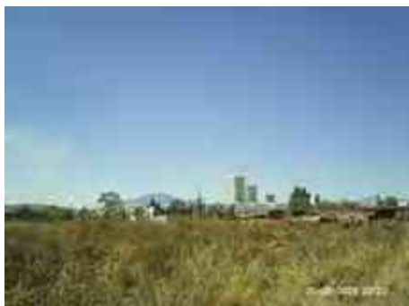
Ilustración 10 alrededores de Jesús del Monte

Imagen urbana es el conjunto elementos naturales y artificiales, que conforma una ciudad, el marco visual de sus habitantes está compuesto de los siguientes elementos: colinas, cuerpos de agua, bosques, edificios a sus alrededores, calles, plaza, área recreativa y deportiva, anuncios, etc. La relación y agrupación de estos elementos define el carácter de la imagen urbana. Otras características del lugar son: topografía, clima, suelo, etc. las costumbres, usos de sus habitantes.