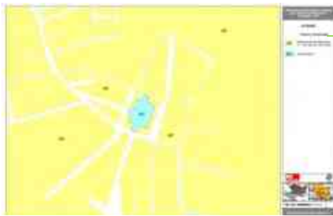
Ilustración 46. Cartografía del uso de suelo

totalmente en nuestro tema de Tesis (ver ilustración 45).