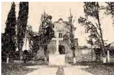
Ilustración 14 Iglesia de la Tenencia Jesús del Monte.

Los pueblos Matlatzinca fueron adoctrinados por los padres agustinos, los pirindas de Jesús del Monte eran dependientes de Santa María, por ello, acudían semanalmente a la doctrina en su cabecera, y solo recibían en sus pueblos los sacramentos el día de la fiesta de su patrón. 3