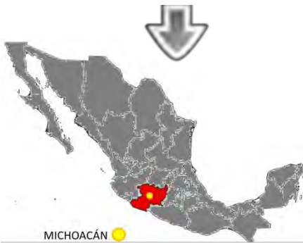
Ilustración 42. Ubicación de Michoacán