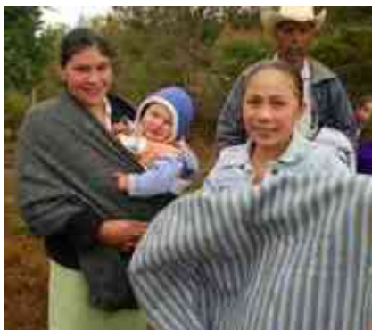
Ilustración 3 familia de la tenencia

La sociedad y el entorno conceptual del espacio es determinada tanto en la naturaleza física de su envolvente, así como en la abstracción de su estructura, al constituirse el elemento de intercalación entre el individuo y su entorno se crea una atmosfera de carácter objetivo.