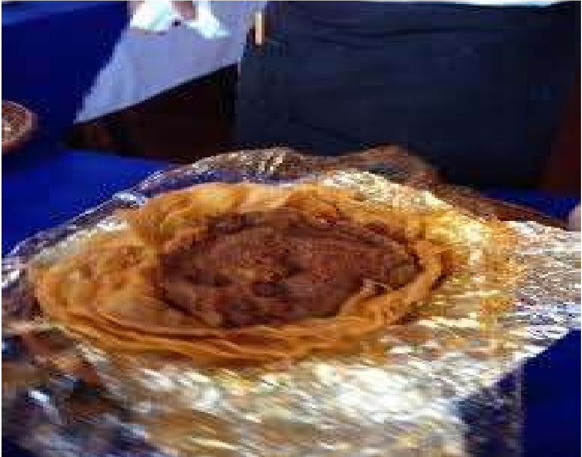
Platillo típico Bola de Pedernales.

En las tiendas de raya de la hacienda de Pedernales en donde los peones de la finca adquirían maíz, frijol y chile, las madres o esposas inventaron las Bolas de Pedernales. Hechas a base de frijoles enchilados refritos, acompañado con carne seca, carne de puerco y queso, las Bolas deben el nombre a su forma. El guiso queda al centro envuelto por tortillas, como si fuera una lechuga, esta envoltura conserva muy bien el calor y la bola puede comerse hasta dos horas después de su preparación, a buena temperatura. Los cortadores de caña de azúcar llevan este platillo a sus lugares de trabajo, ya que a pesar de que laboran durante varias horas el platillo se conserva caliente, por lo que se ha convertido en toda una costumbre entre este sector campesino consumirlas en