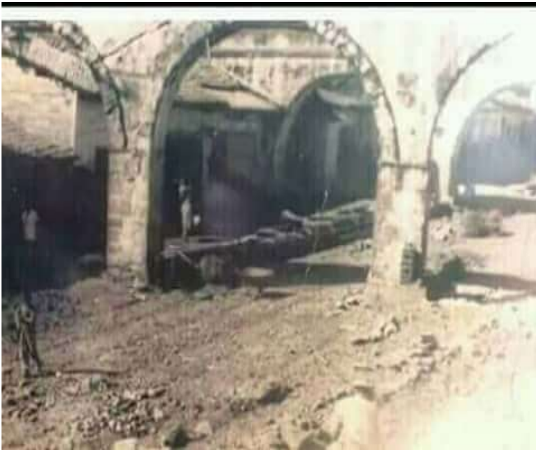
A.H.P. Fotografía de los acueductos de Pedernales en 1970.