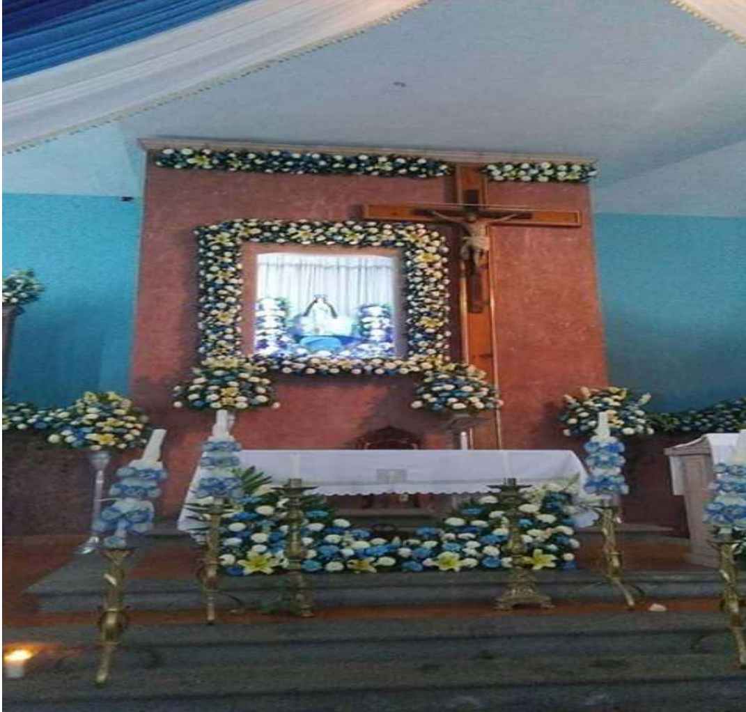
A.H.P. Fotografía tomada a La Virgen de la Salud ubicada en el templo de la comunidad.

Fueron los padres agustinos los que se encargaron de difundir en la pequeña capilla de la hacienda la creencia de la Virgen de la Salud de Pátzcuaro. Su arraigo en Pedernales se dio tras observar que ésta era concebida como protectora y doctora de los trabajadores. A partir de ahí y ante la falta de instituciones de salud en la comunidad, se adoptó a la virgen. Tan grande fue la