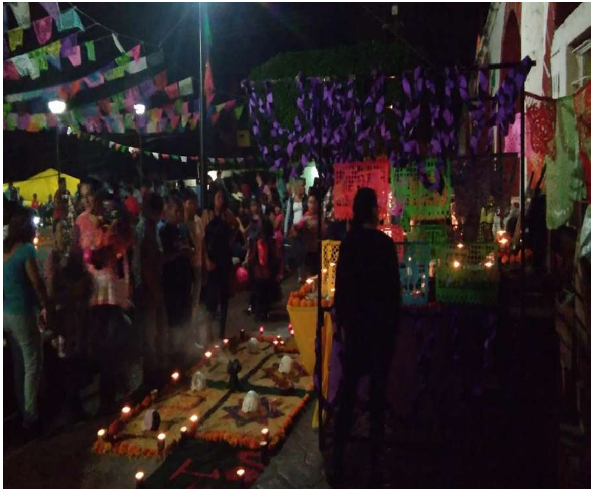
A.H.P. Fotografía tomada a la Plaza pública de pedernales sobre el festejo del Día de Muertos.