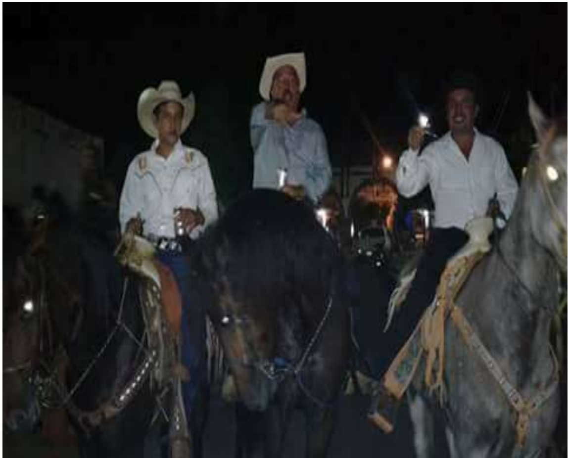
A.H.P. Tradicional cabalgata recorriendo el pueblo en la celebración del día 30 de septiembre.