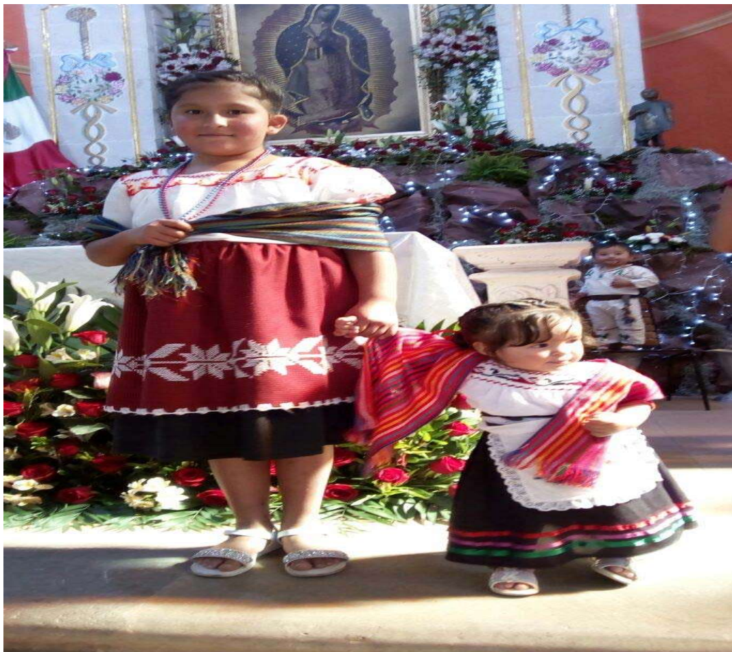
A.H.P. Vestimenta típica sobre el festejo del día 12 de diciembre de las mujeres (guarecitas).