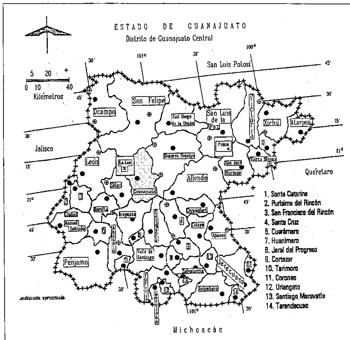
Mapa del estado de Guanajuato a principios del siglo XX