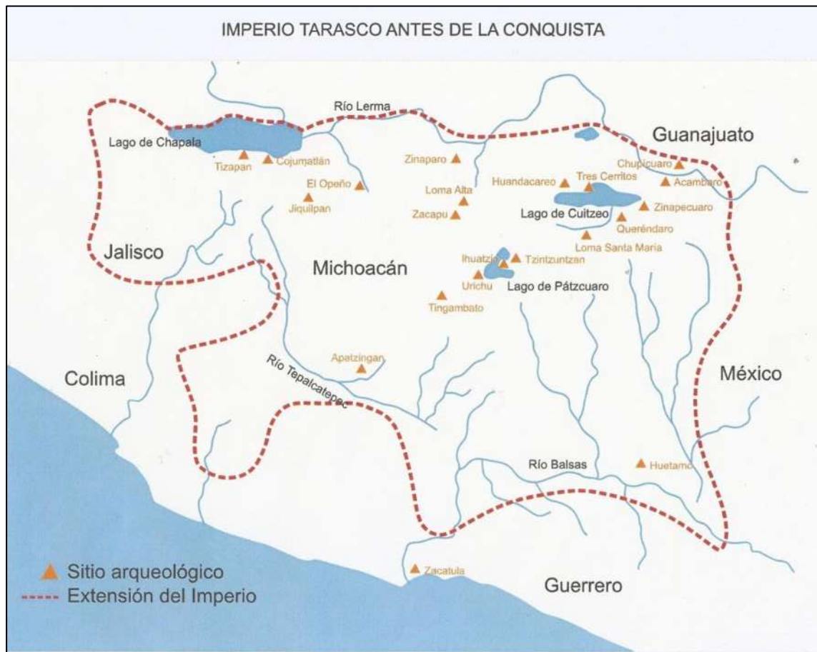
Fig. 5 Imperio Tarasco Antes de la Conquista