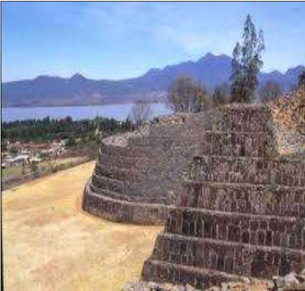
Figura. 2 Detalle de una yácata de Tzintzuntzan