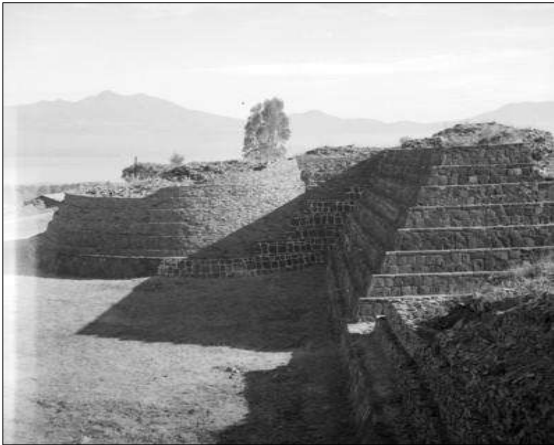
Figura. 4 Yácata de Oceloapan, Veracruz