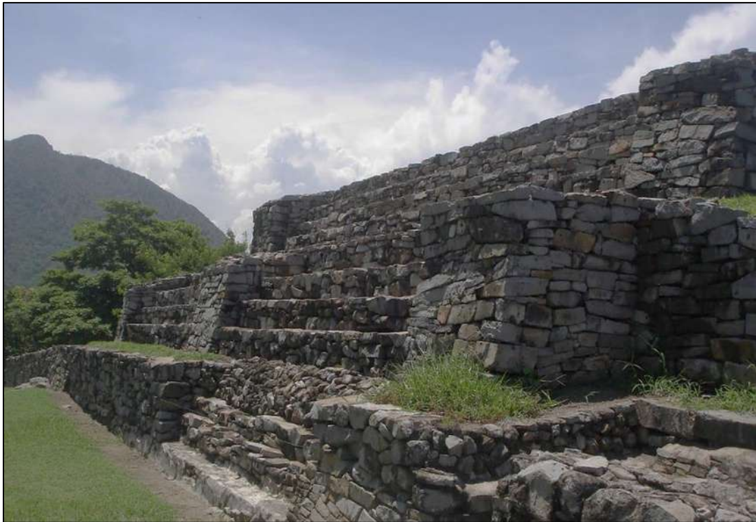
Figura. 3 Yácata de Cempoala, Veracruz