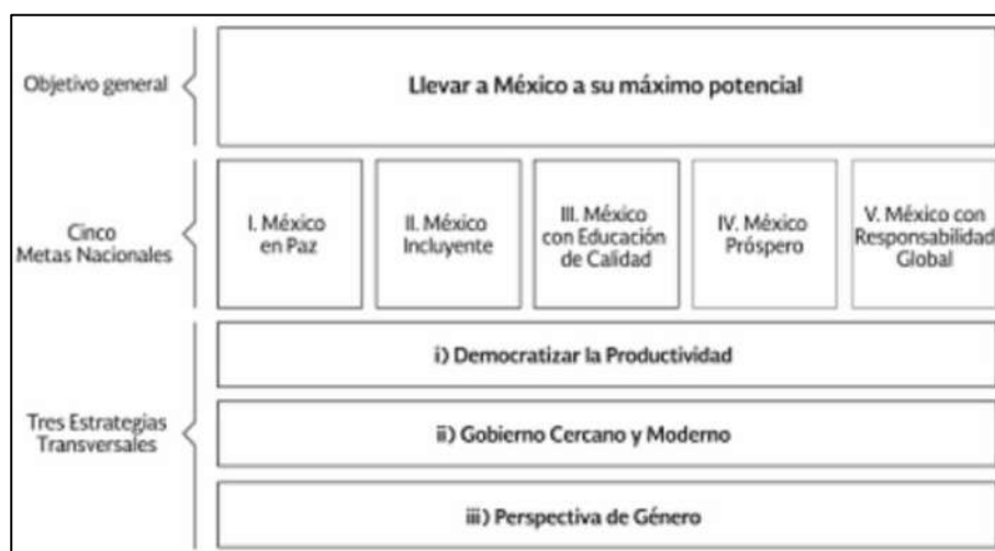
Esquema 2. Plan Nacional de Desarrollo, publicado en el Diario Oficial de la Federación 265 .

Una visión clara de las diferencias entre los cuerpos normativos y a propósito de la instauración de políticas públicas que atienden el mismo fenómeno, pero en diferentes países.