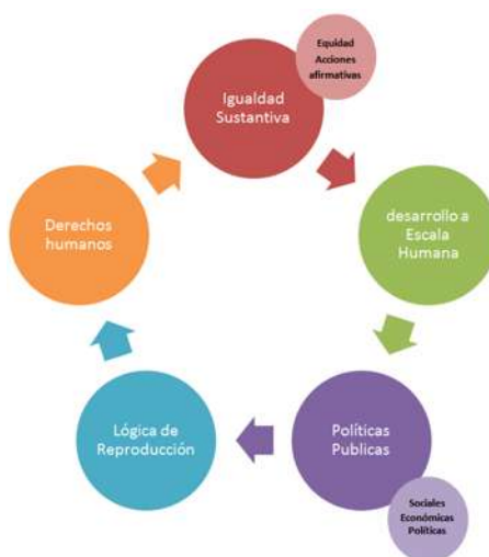
Figura 2. Desarrollo a escala humana, la variable que hace la diferencia. Elaboración propia

Hemos hablado ya acerca de los mecanismos que permitan el pleno disfrute de los derechos humanos por ambos géneros, lo que se constituye en una igualdad sustantiva, sin embargo, en la figura 2 se muestran nuevos elementos: