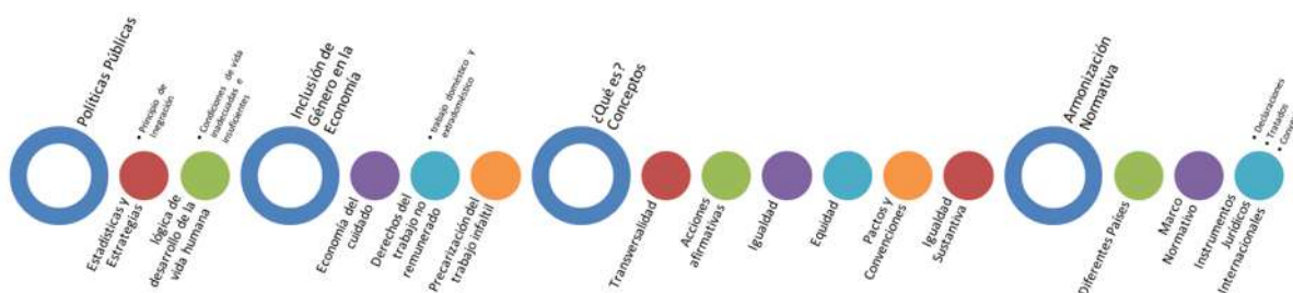
Esquema 1. La inclusión de género en las políticas para el desarrollo. Elaboración propia.

En vista de que en México siguen existiendo personas que no disfrutan de todos los derechos y que la mayor parte de este segmento son personas del género femenino fue necesario explorar una línea de variables que intervienen en la discriminación y la exclusión de las mujeres en la economía, lo cual se muestra en el siguiente esquema: