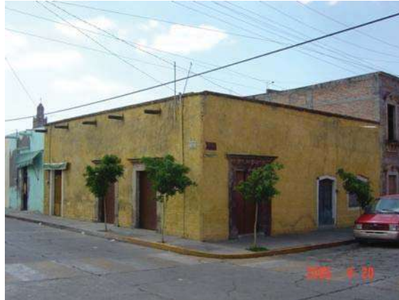
CASA UBICADA EN LA CALLE 5 DE MAYO