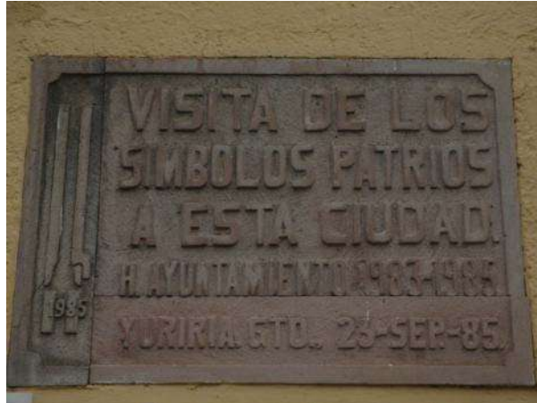
PLACA INFORMATIVA UBICADA EN EL ACCESO DE LA PRESIDENCIA MUNICIPAL

La señalización informativa y promocional, debe adaptarse al contexto y al lugar donde se ubica. Respecto a la señalización en zonas históricas o de edificación patrimonial es muy importante respetar las siguientes recomendaciones: