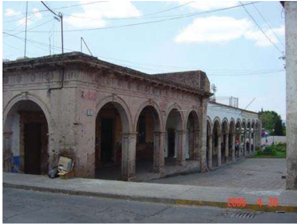
PORTAL HIDALGO VISTO DESDE LA CALLE VICENTE GUERRERO