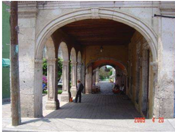
PORTAL ITURBIDE VISTO DESDE LA CALLE GUADALUPE VICTORIA

De acuerdo a su función y tamaño los espacios abiertos se clasifican en: