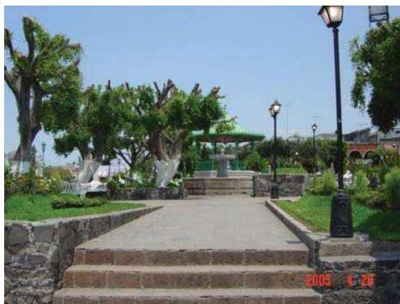
*IMAGEN 16 Vista de la Plaza Juárez, toma de la puerta del Atrio Parroquial rumbo al poniente. Esta Plaza fue construída sobre el terreno que sirvió de panteón y que fue destruido en el año de 1850 por temor a la peste del cólera y expropiado a favor del Municipio. 66

La mayoría de estas edificaciones religiosas se encuentran en el total abandono e incluso algunas de ellas no abren sus puertas al público excepto en las festividades religiosas. Es por ello que también es importante la restauración de estos inmuebles pues su deterioro se debe precisamente a la falta de mantenimiento, por no arreglar a tiempo lo que esta en mal estado además de los daños causados por factores de tipo climático. En el mes anterior se le otorgo un bono al Templo de la Preciosa Sangre de Cristo por ser unos de los templos mejor conservados y es esa clase de incentivos lo que puede hacer que los habitantes de Yuriria se preocupen mas por mantener en buen estado sus edificaciones.