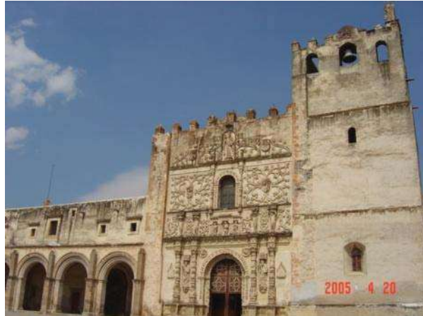
PORTADA DEL EX -CONVENTO DE SAN AGUSTÍN

Dentro de la llamada Arquitectura Relevante podemos ubicar las instalaciones que ocupa la Presidencia Municipal ya que se encuentra dentro de la superficie que envuelve a la descrita anteriormente; se caracteriza por corresponder a la traza reticular, integrada en el año de 1580, presenta una pendiente descendente de Sur a Norte y en ella están ubicados todos los inmuebles con tipología de Arquitectura Relevante catalogados o no por el INAH.