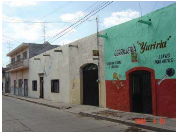
CASA UBICADA EN LA CALLE JUÁREZ