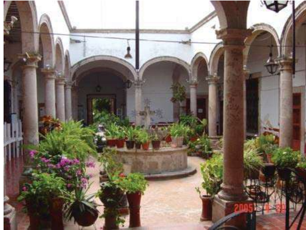
PATIO PORTICADO DE LA PRESIDENCIA MUNICIPAL