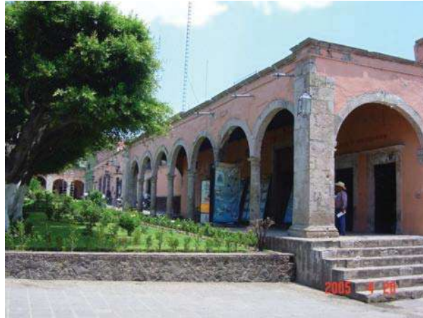
PORTAL HIDALGO VISTO DESDE LA EXPLANADA