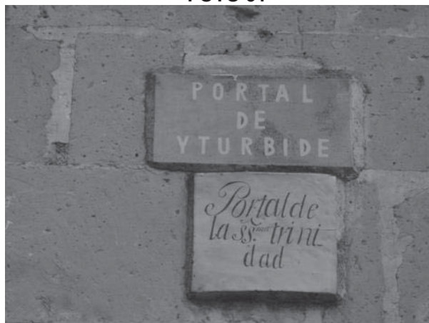
PLACA INFORMATIVA LOCALIZADA EN EL ACCESO AL PORTAL ITURBIDE