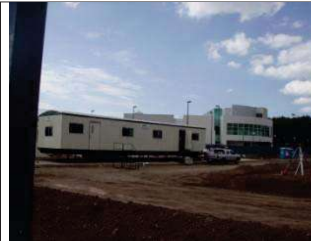
Descripción: Estacionamiento, mejoramiento de terreno. Se verificó las pruebas de calidad.