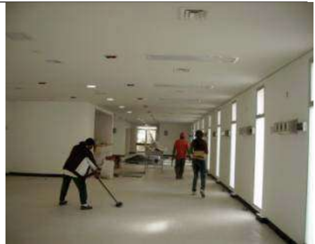
Descripción: Hospitalización. Se verificó se realizaran los trabajos con la calidad prevista.