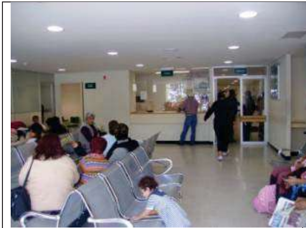
Descripción: Sala de espera urgencias en funcionamiento. .