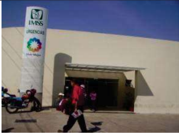
Descripción: Acceso actual del área de urgencias.