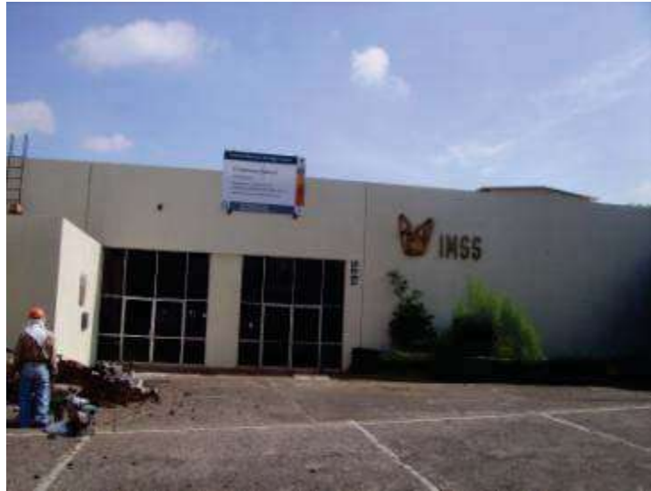
Centro de Seguridad Social, ubicado en Av. Camelinas, edificio que se amplió y remodeló para trasladar al Hospital Regional No. 1 de Av. Nocupétaro en Morelia Michoacán. (Fachada principal en proceso de remodelación)