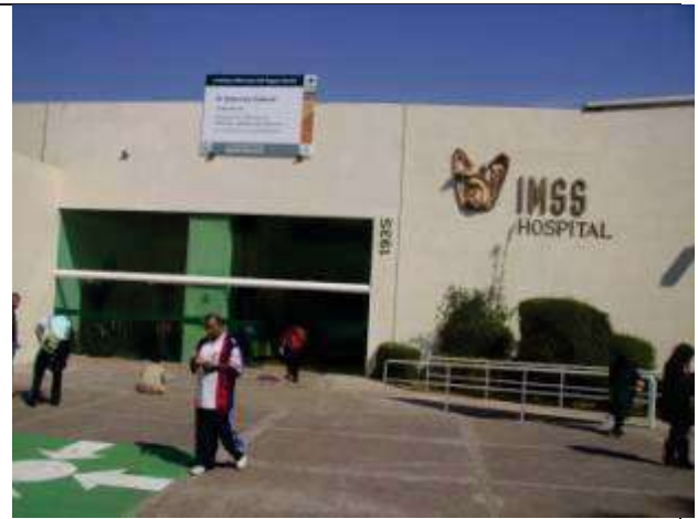
Descripción: Acceso principal Actual.