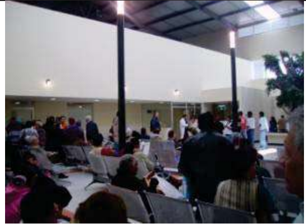
Descripción: Sala de espera Actual.